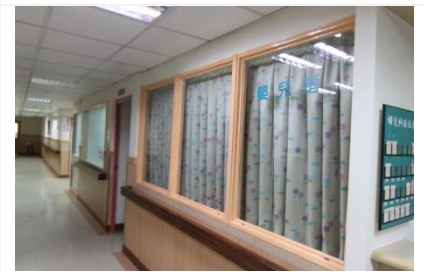
婦兒科整修營造溫馨感