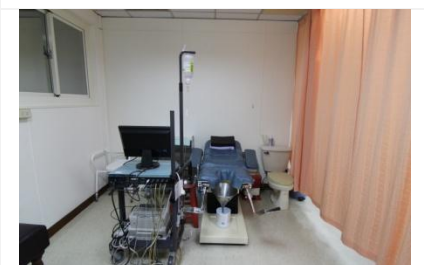
尿路動力學檢查室