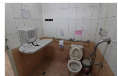
廁所設置換尿布台