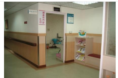
婦產科門診及候診區